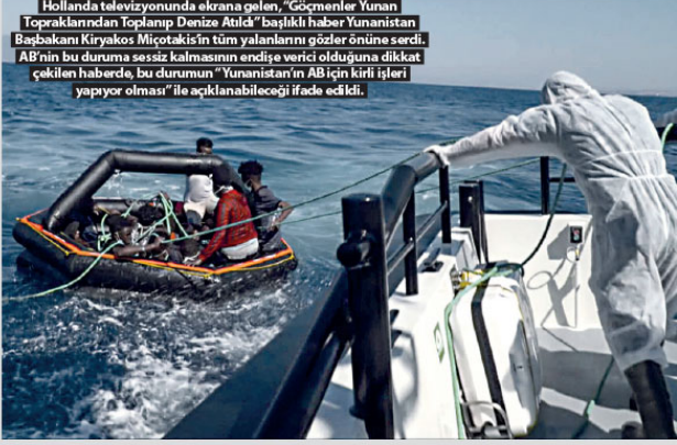
Hollanda televizyonunda ekrana gelen, "Göçmenler Yunan Topraklarından Toplanıp Denize Atıldı" başlıklı haber Yunanistan Başbakanı Kiriakos Miçotakis'in tüm yalanlarını gözler önüne serdi. AB'nin bu duruma sessiz kalmasının endişe verici olduğuna dikkat çekilen haberde, bu durumun "Yunanistan'ın AB için kirli işleri yapıyor olması" ile açıklanabileceği ifade edildi.

Yunanistan Cumhurbaşkanı Katerina Sakellaropulu, ülkesinin Fransa'dan 18 adet savaş uçağı alma, donanmaya dört yeni fırkateyn katma ve 15 bin yeni askerle silahlı kuvvetleri güçlendirme kararı için "Eğer barış istiyorsanız, her zaman savaşa daha iyi hazırlıklı olmalısınız" dedi.