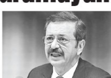
TOBB Başkanı Hisarcıklıoğlu

TOBB Başkanı Hisarcıklıoğlu, geleceğin e-ticarette olduğunu, teknolojiye ayak uyduramayanın geri kalacağını söyledi.