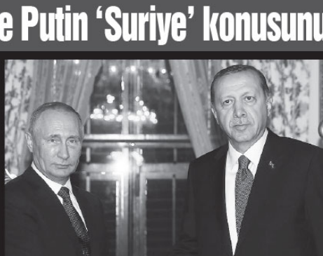
Erdoğan ve Putin 'Suriye' konusunda görüşü.

Cumhurbaşkanı Tayyip Erdoğan, Rusya Devlet Başkanı Vladimir Putin ile telefonda görüşü.