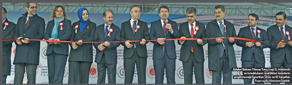
Adalet Bakanı Yılmaz Tunç (sağ 5), hükümlü ve tutukluların ürettikleri ürünlerin sergileneceği 'Siyurt Ürün ve El Sanatları' Fuarı açılış törenine katıldı.