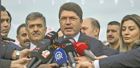
kememizin bir görüş farkı var burada. Bu görüş farkından yola çıkarak bunu farklı noktalara çekmenin hiçbir anlamı yok." CHP Genel Başkanı Özgür Özel'in, bu tartışmalar üzerinden Cumhurbaşkanı Recep Tayyip Erdoğan'a yönelik "yaşaklıksız ifadeler" kullandığını söyleyen Tunç, sunulan kaydedti: "Bunlar sorumsuzca ifadeler. Burada Cumhurbaşkanı'mızın sanki darbeye yapıldığı şeklindeki yorumuna kestirilmeli de katılmıyoruz. Burada herhangi bir darbe söz konusu değil. Bu millet darbenin ne olduğunu çok iyi biliyor. Bu millet 27 Mayıs darbesini bayram olarak kutlayan zihniyeti de biliyor, Yassıada zihniyetini de hiç unutmamıştır bu millet. Bu millet 15 Temmuz hain darbe kalkışmasına kimin kontrolü darbe dediğini de çok iyi biliyor. Bu millet darbeyi de çok iyi bilir, darbeleri de darbe şaşıklıklarına bilir." Adalet Bakanı Tunç, iki yüksek mah-

Anayasa'daki düzenlemeleri hatırlatan Tunç, şöyle devam etti: "Seçimden önce soruşturmasına başlanan terör suçlu dokunulmazlık kapsamında mı, değil mi? Tartışma konusu bu. Seçimden önce soruşturmasına başlanmış olmak kaydıyla terör suçlu, Anayasa'nın 83. maddesine göre dokunulmazlık kapsamı dışındadır diyor Anayasa, Yargıtay da bu görüşte. Anayasa Mahkemesi ise şunu söylüyor: Anayasa'nın 14. maddesine atfı yapılan bu suçlar belirli değil, devletin güvenliğine ilişkin suçların tek tek sayılması gerekir" diyor. Yargıtay da "bu suçlar belirlidir, zaten kanunla düzenlenmiştir, Türk Ceza Kanunu'nun devletin güvenliğine ilişkin suçlar tek tek yazılmıştır ve bu dokunulmazlık kapsamının dışındadır" diyor. Tartışma buradan çıkıyor. İki yüksek mah-