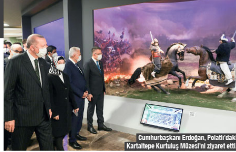
Cumhurbaşkanı Erdoğan, Polatlı'daki Kartaltepe Kültürü Müzesi'ni ziyaret etti.

Cumhurbaşkanı Erdoğan, Cumhuriyetin 100. yılı olan 2023'e endekslenen hedeflerin, aslında tıpkı Milli Mücadele'nin kendisi gibi küresel senaryolara karşı bir başkaldırı olduğunu söyledi. Türkiye'nin kendi verdikleri rollerin dişiyle çıkmasını istemeyenlere, almı tene ve kanla, istiklale ve istikbaline sahip çıkan bir ülke olduğuna geçmişi kalite ettirdiklerini vurgulayan Cumhurbaşkanı Erdoğan, "Bazılar hâlâ 2023 hedeflerimizi sıradan bir orta, uzun vadeli kalkınma programı sanmaya devam ediyor. Halbuki biz bu iradeyi ortaya koyarak Cumhuriyet tarihinin en iddialı ve cesur maksad değişikliğini gerçekleştirdik. Demokrasinin ve kalkınma standartlarının dünyanın en leri ülkeleri seviyesine çıkartarak, asırlardır kışkırtma altında tutulan medeniyet, tarih ve kültür ülkemize tekrar açmayı başardık" diye konuştu.