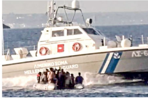
Atina hükümeti ise uluslararası basın ve sivil toplum kuruluşları tarafından ortaya konulan çok sayıda haber, rapor ve göçmenlerin tanıklıklarına rağmen bu vakaları inkar ediyor.

Avrupa Birliği (AB) Komisyonu Yunanistan'dan, talep ettiği ek göç fonunu sağlamak için sınırındaki göçmenlerin geri itilmesini izlemek ve önlemek için "bağımsız" bir mekanizma kurmasını istedi.