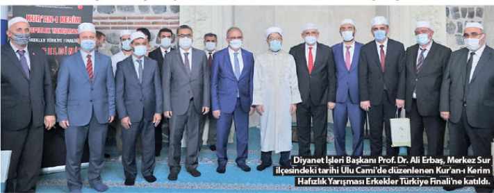
Diyanet İşleri Başkanı Prof. Dr. Ali Erbaş, Merkez Sur ilçesindeki tarihi Ulu Cami'de düzenlenen Kur'an-ı Kerim Hafızlık Yarışması Erkekler Türkiye Finali'ne katıldı.

Diyanet İşleri Başkanı Erbaş, vatandaşların ve nesillerine dine ve hayata dair doğru bilgiye ulaşmalarında Kur'an kurslarını büyük bir imkan olarak gördüklerini belirterek "En büyük idealimiz, Rabb'îyle kendiyile topluma barışık, sorumluluk sahibi bireyler yetiştirmek dedi.