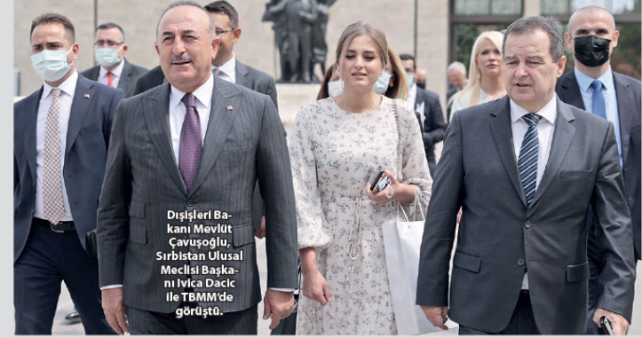
Dışişleri Bakanı Mevlüt Çavuşoğlu, Sırbistan Ulusal Meclisi Başkanı Ivica Dačić ile TBMM'de görüşte.

Afgan halkına insani yardımın ahlaki bir görev olduğunu söyleyen Çavuşoğlu, "Ülkelerimiz ile Afganistan arasındaki mesafe birer yanıtlanmamalı. Afganistan'daki bir insani ve güvenlik krizi dünyaya doğrudan etki edecektir. Bu yüzden şimdilik birlikte hareket etmeliyiz." diye konuştu.