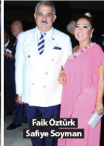
Faik Öztürk Safiye Soyman