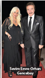
Sevim Emre-Orhan Gencebay