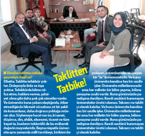
■ Etkinlik tabiiyetin tabiiyetini geçermiyiz dediği mi? Elbette. Taklitten tefekkür yoktur. Dolayısıyla ibda ve inşa yoktur. Tefekkür bilme nüfuz etme, haklarını verme, şahsiyet olma gibi daha pek çok nimetler vardır. Ve üniversite buna yabancılaşmıştır. İtibar etmediğimiz bilimsel yoldanma zıt bir şekilde de konuların, daha doğrusu yokluğuna münecer olur. Söylenmeye hacet var mı, ki sanat, düşünce, din, ahlak, ekonomi, ticaret ve tüm hayat ta, bunların tekmilüğü de bu mübarek değerlerin meyveleridir. Beyna nispetle üniversite ayrı zamanda millî tecrübeyi, birikimi de-

Hocam bir eğitim bilimci olarak eğitim nedir? Bu, azım bir soru. Pek çok şeyi ihtiva ediyor. Eğitim üzerine konuşmak, dolayısıyla pek çok şey üzerine konuşmaktır. Bu önemli husus geçirdi edilince, ülkemizde, hatta pek çok ülkede eğitim söz konusu olunca önemli bir hataya düşülmektedir. Genellikle meseleyle ilgili bakılır. Eğitim her şeydir. Ona sahip olmakla insanı, topluma, düzene, toplumsal problemlere ait pek çok hususla düzletilebileceğine inanılır. Elbette eğitimin gücüne inanıyoruz. Ama eğitim her şey değildir. Mesela sizin bir insan felsefesiz yoksun, kimi, neyi yetiştireceğinizi yeterince belirlemezsiniz. Aynı şekilde gücü bir ekonominde mahrumunuz eğitimden beklenilen sonuçları alamaz. Her şeyi eğitimin beklemeli, bütün olumsuzluklardan eğitimi mesul tutmak bilimsel değil, makul değil. Buna rağmen eğitimi bütünüyle masum da görmemek gerekir. Eğitimden beklenilenler, biraz da onu nasil gördüğümüzle, ne olduğu hususunda ki algımızla ilgilidir.