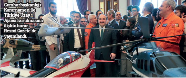
Cumhurbaşkanlığı Kararnamesi ile Türkiye Uzay Ajansı kurulmasına ilişkin karar Resmi Gazete'de yayımlandı.

Ticaret, bilimsel ve araştırma-geliştirme amaçlı uzay operasyonları ile insanlı veya insansız uzaya erişim ve uzay keşfi amaçlı operasyonları yapabilecek uzay yapılarının koordinasyonunu sağlamak, uzay araçları, simülasyonlar, uzay platformları dahil uzay ve havacılıkla ilgili