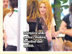
Dünya çalkıcı Shakira, İstanbul'dan ayrıldı.