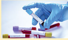
11 Nisan'da ise bu oran yüzde 1,85 olarak kayıtlara geçti.