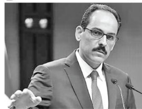
Mehmet Görmez, Türkiye Diyanet Vakfı tarafından Haliç Kongre Merkezi'nde bu yıl üçüncüsü düzenlenen Uluslararası İyilik Ödülleri törenine katıldı.