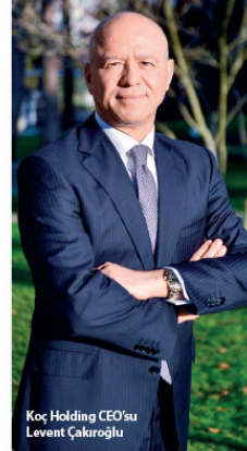
Koç Holding CEO'su Levent Çakırçoroğlu

faaliyetlerimizi sürdürdüğümüz pek çok farklı ülkede ve sektörde sağladığımız istihdam, sunduğumuz ürün ve hizmetler ve kurumsal vatandaşlık bilinciyse, tüm paydaşlarımızın katkı değer yaratmaya devam edeceğiz" ifadelerini kullandı.