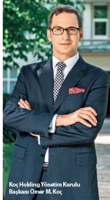
Koç Holding Yönetim Kurulu Başkanı Ömer M. Koç

Açıklamada görüşlerine yer verilen Koç Holding Yönetim Kurulu Başkanı Ömer M. Koç, koronavirüs salgınının iş dünyasının mücadele ettiği sorunlarla birlikte ve çok yönlü çözümler geliştirilmesini önemini ortaya çıkararak belirterek, "Koç Topluğu olarak ülkemizin ekonomik gelişimine sağladığımız katkıları ve milyonlarca insanın yaşamını iyileştirme konusundaki kritik rolümüzün farkındayız. Bu nedenle