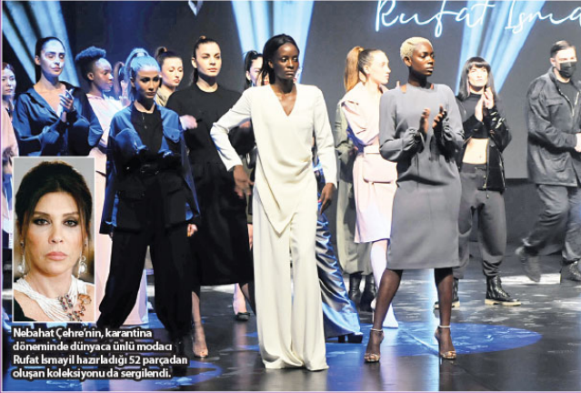
Nebahat Çehre'nin, karantina döneminde dünyaca ünlü modacı Rufat İsmayil hazırladığı 52 parçadan oluşan koleksiyonu da sergiledi.

Moda dünyasının en iyileri ödülleri aldılar. 9.Fashion TV Moda Ödülleri Töreni gecesine ünlü isimler damga vurdu. Üçüncü kez Fashion TV'den çifte ödül olarak bu alanda bir ilke imza atan ve ödülünü almak üzere sahneye çıkan Tülin Şahin yaptığı konuşmada "2 Ödülümü alıp çok acil eve gitmem lazım çünkü bebeğimi emzirmem gerekiyor" dedikten sonra salonu terk etti.