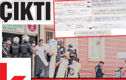
'HENDEK' DE AJANDADA

HDP'nin Diyarbakır il binasında gizli bir bölümde bulunan ve bazı parti yöneticilerinin "Seçilmiş delegelerimizin isimleri var." dediği ajandada, birçok saldırının faili PKK'lı teröristlerin isimleri, kod adları ve yakınlarının irtibat numaralarının yer aldığı belirlendi.