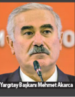
Yargıtay Başkanı Mehmet Akarca

Yargıtay Başkanı Mehmet Akarca da iyi işleyen bir hukuk sisteminin insan haldarının, demokrasinin, özgürlüğün, kişli güvenliliğinin, kalkınmanın ve refahının en önemli koşulu ve unsur olduğunu kaydetti.