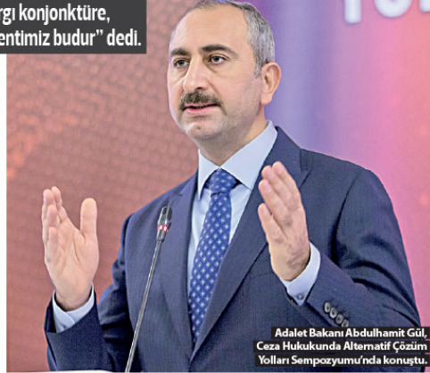
Adalet Bakanı Abdulhamit Gül, Ceza Hukukunda Alternatif Çözüm Yolları Sempozyumu'nda konuştu.

Adalet Bakanı Gül, 2 gün sürecek sempozyumda, alternatif çözüm yollarına ilgili daha geniş, daha kapsamlı konularda fikir alışverişini sağlanacağı, bütün çalışmaların merkezinde daha iyi işleyen, daha öngörüle-