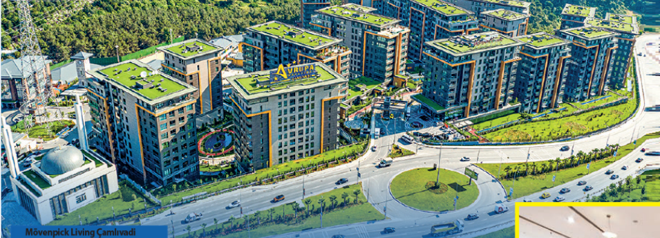
Mövenpick Living Çamlıvadi

Avrupa Konutları markasının yaratıcısı Artaş Holding'in, AVM, rezidans, ticari üniteler, satışa hazır konut projeleri ve devam eden konut projeleri olmak üzere, düzenli kira getirili ve çeşitlendirilmiş bir portföye sahip olan Avrupalent GYO halka açılıyor. Halka arz için 13-14-15 Aralık tarihlerinde, Ak Yatırım liderliğinde oluşturulan konsorsiyum tarafından talep toplanacak.