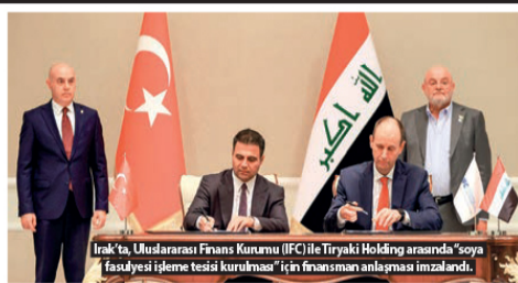
Irak'ta, Uluslararası Finans Kurumu (IFC) ile Tiryaki Holding arasında "soya fasulyesi işleme tesisi kurulumu" için finansman anlaşması imzalandı.

Neczar ise yapılan anlaşmanın önemine değinerek, sunulan kaydetti: "Bu anlaşma, iki taraf arasında bir ilk tir ve daha çok anlaşmalarla sonuçlanacak. Türk şirketleri Irak'taki yatırım fırsatlarını önemli bir bölüme değerlendirmeye