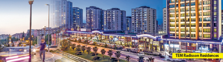
TEM Radisson Residences