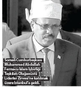
Somali Cumhurbaşkanı Muhammed Abdullah Fermacü İslam İşbirliği Teşkilatı Olağanüstü Liderler Zirvesi'ne katılmak üzere İstanbul'a geldi.

Trump, geçen hafta düzenlediği basın toplantısında, Birleşmiş Milletler Güvenlik Konseyi'nin (BMKG) 1980 yılında İsrail'in Doğu Kudüs'ü ilhak ederek başkent ilan etmesini geçersiz sayan