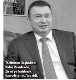
Tacikistan Başkanı Kahir Rasulzade, Zirve'ye katılmak üzere İstanbul'a geldi.

478 sayılı kararına rağmen, "Kudüs'ü resmen İsrail'in başkenti olarak tanıma zamanı geldi." ifadesini kullandı. ABD lideri, ayrıca Dışişleri Bakanlığına, ülkesinin Tel Aviv'deki büyükelçiliğini Kudüs'e taşıması için hazırlıkları başlaması talimatı verdiğini açıkladı.