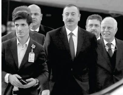
Azerbaycan Cumhurbaşkanı İlham Aliyev (ortada), İslam İşbirliği Teşkilatı Olağanüstü Liderler Zirvesi'ne katılmak üzere İstanbul'a geldi.

İslam İşbirliği Teşkilatı (İİT), ABD Başkanı Donald Trump'ın Kudüs'ü "İsrail'in başkenti" olarak tanıma ve ABD Büyükelçiliğini Tel Aviv'den Kudüs'e taşıma yönündeki planını açıklamasının ardından dönem başkanı Türkiye'nin ev sahipliğinde olağanüstü toplantıyor.