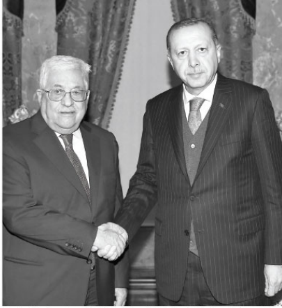
Cumhurbaşkanı Recep Tayyip Erdoğan, Filistin Devlet Başkanı Mahmud Abbas ile Beylerbeyi Sarayı'nda bir araya geldi.