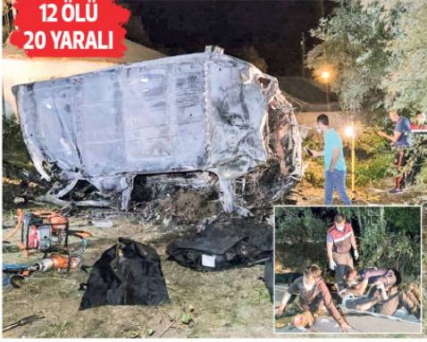
12 ÖLÜ 20 YARALI