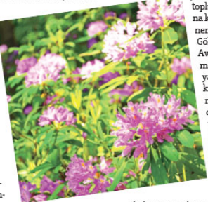
Karaçam (Pinus nigra) ormanlarının tahrip edildiği sahalarda yer alır. İznik Gölü'nün kuzeyinde güneye bakan yamaç batı kesimindeki Saçlı meşe (Quercus cerris), doğuda Mazi meşesi (Quercus infectoria) topluluklarının tahrip sahalarda, yoğun bir maki örtüsü yer alır.

Bursa coğrafyasındaki yaygın kızılçam ormanları; Orhanlı ve Mustafakemalpaşa'nın güneye bakan yamaçlarında görülür. Bu bölümlerdeki kızılçamların iklim şartlarına bağlı olarak oluşturduğu topluluklar ve biyokültür verimleri farklıdır. Genel olarak bölgenin diğer bölgelere göre yaz kuraklığının fazla hissedilmemesi kızılçamların gelişimini olumsuz yönde etkilemektedir. Ancak sıcaklığın düşük olması büyüme hızını azaltmaktadır. Bu nedenle de kızılçamlar, diğer bölgelerde olduğu gibi yüksek sahalara çıkmamakta ve genel olarak 400-500 metre yüksekliğe sona ermektedir. Örneğin Yenişehir'in güneydoğusunda 400-500 metreye kadar olan alanlarda kızılçam ormanları yaygındır. Bursa'da en uygun koşullarda yetişen