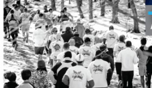
Ormanda doğal ve özel parkurda yapılan Cross Challenge'nin kendine özgü bir katılımcı profili var.