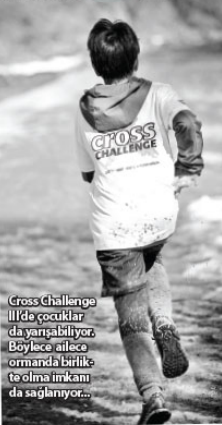
Cross Challenge III'de çocuklar da yarışabiliyor. Böylece ailece ormanda birlikte telt olma imkanı da sağlanıyor...

YARIŞLAR VE OUTDOOR KÖYÜ İÇİN BİLGİ 2 Nisan ve 22 Ekim'de gerçekleştirilecek orman koşusu ve outdoor köyü etkinliklerine Online kayıt için: https://crosschallenge.com/ veya Ayp.Solutions (www.aypsolutions.com) diğer adıyla Antrenmanyaap diğer adıyla Antrenmanyaap sitesinden bilgi alabilirsiniz #herkesormana #crosschallenge