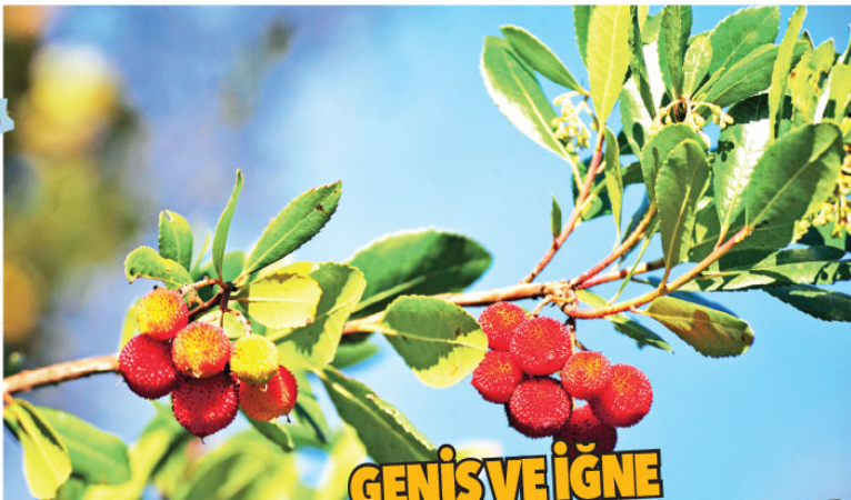
kızılçam ormanlarında Mustafakemalpaşa'da rastlanır.