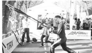
Yarışmacılar ve diğer katılımcılar isterlerse diğer spor aktivitelerinden de yararlanabiliyorlar.