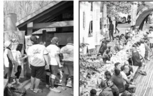
Outdoor Köyü'nde konseptle uygun firmalar, markalar stand açarak adeta fuar ortamı yaratıyorlar.