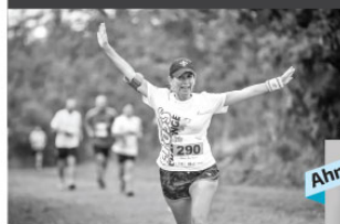
Cross Challenge yarışları ormanda yapılıyor. Kontenjan sınırlı tutulduğu için belirli bir kalite muhafaza ediliyor.

İstanbul'a bu kadar yakın olup, aynı zamanda da şehrin temposundan bu kadar uzak olabileceğiniz yegâne etkinlik önerisi: Cross Challenge III & Outdoor Köyü... İsteyenler ormanda koşarken, diğer konuklar da Outdoor Köyü'nde doğayla ve doğal olan hemen hemen her şeyle hoş bir zaman geçirebilecekler.