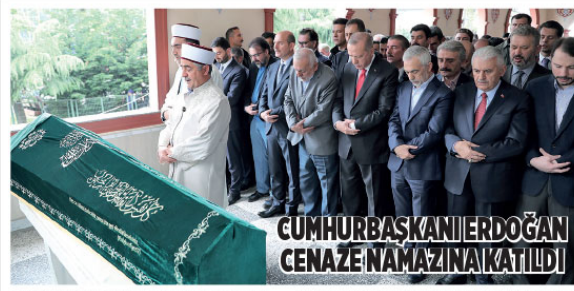
CUMHURBAŞKANI ERDOĞAN CENAZE NAMAZINA KATILDI

baş tacı kabul eden, 'Ana gibi yar olmaz' diyen, anneye hürmeti esas alarak, annelliğün dünyanın en müstesna mertebesi olarak gören bir kültür ve geleniğin temsilcileriyiz. Bu anlayışla annelerimizin mutlu olması, yüzlerinin gülmesi, hayat şartlarının daha da iyileştirilmesi için önümüzdeki süreçte de kararlılıkla çalışmaya devam edeceğiz. Baş tacımız, ilk öğretmenimiz, ilk hamimiz, sigmamız, gücümüz olan annelerimiz, ülkemizin, milletimizin, çocuklarımızın hayır dualarını eksik etmesin. Ömürlerini ailelerine vakfeden, her daim hürmetlerini en büyüğüne hak eden annelerimizin, Anneler Günü'nü kutluyor, ahirete irtihal etmiş tüm annelerimizi rahmetle ve minnetle yad ediyorum."