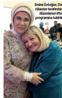
Emine Erdoğan, Darılcıca tarafından düzenlenen İftar programına katıldı.