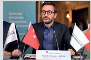
Prof. Dr. Fahrettin Altun, çalıştayda konuşuyor.

Altun, düzenlediği "Kamusal İletişim Standartları, Entegrasyon ve Koordinasyon Çalıştay"ı kamu kurum ve kuruluşlarının iletişim standartlarının belirlenmesi nokta-