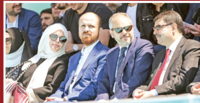
Dünya Etnospor Konfederasyonu tarafından organize edilen Etnospor Kültür Festivali'nin ikinci, "Ok Yaydan Çıkıyor" sloganıyla İstanbul'da başladı. Yenikapı Etkinlik Alanı'nda düzenlenen festivalin açılışına Gençlik ve Spor Bakanı Akif Çağatay Kılıç (sağ 2), İstanbul Valisi Vasip Şahin (sağ 3) ile Dünya Etno Sporları Konfederasyonu Başkanı Bilal Erdoğan da (sağ 3) katıldı.