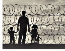
ayaklarının birbirine karşığını gördüm. Başta Avusturya içişleri bakanının başışları ve sorularına diyeçiklerini bilemez bir haldeki tavırları dikkat çekiydi. Almanya, Fransa ve diğer batı ülkeleri hepsi bu göç dalgasından paylarını alacakları muhakkak. Haftalık Frankfurter Woche dergisi Cımburbaşkanı Erdoğan'ı kapagina taşıyarak provakatör kelimesini kullanmış. Yunanlıların yaptıklarını kınyacaklarına hala Türkiye ve Erdoğan ile uğraşıyorlar. Hâlâ anlamadınız mı? Mesele Erdoğan değil!

gibi bakımleri çoğaldı. Çocuklar anne ve babalarına bakımları yüksünüp güya daha rahat ederler, sosyalleşir diye utanmadan üstlerinden atıyorlar. Hastalıkları ile baş edemeyen diye içlerini rahat ettiriyorlar ama nafle çocukları da görüyor ninelerine dedelerine yapılanları. Onlar da yaşlanacak. Sevgi, şefkat ile hemhal olan biri alle büyüklerini ne pahasına olursa olsun bakımlerine bırakamaz. Bakımlerine eksik diyoruz. O eski özlemi duyduğumuz nine ve dedelerimiz de arti hanesine koyarak onları yeniden keşfetmeyi umuyoruz.