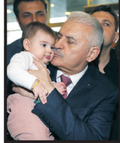
beraberler." diye konuştu. "FARKLILIKLAR BİZİM ZENGİNLİĞİMİZDİR" Bu topraklarda yaşayanların bin yıldır birliktelik için adettiklerini ve beraber

yaşadıklarını söyleyen Yıldırım, "İstiklal mücadelesi vermişiz. Bütün bunları yaparken hiçbirimiz diğerinin kimliğini bilmemiştik. Kürt, Türk, Çerkez, Roman, Abaza mısınız? Bunlara bakmamışız. Etnik kimliğinizle gurur duyun. Hiç de bundan dolayı aşağılık duygusuna kapılmayın. O kimlik sizin şerefinizdir. Kürt iseniz Kürtlüğünüzle gurur duyun. Türk iseniz Türklüğünüzle gurur duyun. Laz iseniz Lazlıklarınızla gurur duyun. Çerkez iseniz Çerkezlüğünüzle gurur duyun. Arap iseniz Araplıklarınızla gurur duyun. Bunlar sizin fitratınızdan gelen özelliğiniz. Ama şunu unutmayın. Hepimiz, hangi etnik gruba sahip olursak olalım. Biz birleştiğimiz ay yıldızlı bayrağımız, toprağımız, devletimizdir. Türkiye Cumhuriyeti devletidir, Türk Milletidir. Bu ilkelere etrafında birleşmek kaydıyla her türlü farklılıklar bizim zenginliğimizdir. Olaya böyle bakıyoruz. Başından beri böyle bakıyoruz."