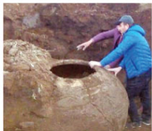
Niğde'nin Altınhisar ilçesinde bir çiftçi, traktörle tarlasını sürerken Bizans dönemine ait olduğu değerlendirilen erzak kipi buldu.

Kınık, bir süre sonra yaptığı paylaşımında ise, "Arkadaşlar Cerrahpaşa'da İsmet Özel'in anjionüven çıktığını, durumunun stabil olduğunu ve by-pass ameliyatına hazırlandığını şimdiki illetler" şeklinde paylaşımında bulundu.