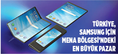
TÜRKİYE, SAMSUNG İÇİN MENA BÖLGESİNDEKİ EN BÜYÜK PAZAR

Samsung'un temel teknolojilere büyük yatırım yaptığını işaret eden DaeHyun, şöyle devam etti: "Yapay zeka ve 5G gibi yeni teknolojileri geliştirmek için önmümüzdeki üç yıl içinde 22 milyar dolar tutarında yatırım gerçekleştireceğiz. 5G'deki bilginizin Türk halkına yararlı olmasını sağlamak için anlaşmalar yapıyoruz. Siyasi ve ekonomik konjiktüre bakmaksızın, Türk tüketicisinin hayatına değer katmaya devam edeceğiz. Katlanabilir telefonumuz Galaxy Fold ile tüketicilerimize heyecanlandıran bir ürün ortaya çıkardık. Açıldığında 7,3 inç büyüklüğüne ulaşan Galaxy Fold ile YouTube, WhatsApp ve Google'i aynı anda kullanabilirsiniz. Pazarı çok büyük bir yenilik getiren Galaxy Fold'u 27 Nisan'da Türkiye'de satışa sunacağız."