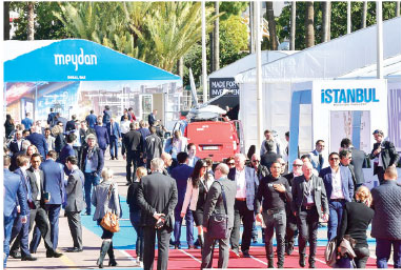
Mimarlık, Yeditepe Gayrimenkul Yatırım A.Ş., Entegre Proje Yönetim ve Danışmanlık, Dome + Partners,

Bu yıl toplamda 21.500 metrekarelik alanda temsil edilecek olan MIPIM'de ziyaretçi kişi sayısı ise 26.000'e ulaşmış durumda. MIPIM 2019'da 360'ün üzerinde konuşmacı da görüşlerini paylaşacak. Toplam 100 konferans ve oturumda 30'uncu yılını geride bırakan fuarında gayrimenkul sektörünün gelecek 30 yılın dair öngörülerde bulunulacak. Türkiye'nin 206 kurum ve kuruluşu toplam 1.020 m 2 bir alanda temsil edilecek fuara katılacak uluslararası firma sayıları ise şöyle: proje finansman alanında 5.000, geliştirici alanında 4.800, mimarlık alanında 2.000, mülk sahibi alanında 1.600, hizmet sağlayıcı alanında 4.000, portfolyo yönetimi ve ikincil piyasalar alanında da 5.400 kuruluşun kayıt sağlandı.