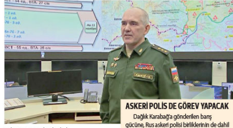
ASKERİ POLİS DE GÖREV YAPACAK

Dağlık Karabağ'da temas hattı boyunca ve Laçın koridorunda 16 gözlem noktası kurulacağı bilgisini paylaşan Rudskoy, "Ermenistan ile Azerbaycan arasındaki anlaşmaların uymu kontrol etmek için (Dağlık Karabağ'da oluşturulan) 'Kuzey ve Güney' sorumluluk alanlarında 16 gözlem noktası kurulması planlanıyor. Bunlar, Dağlık Karabağ'da temas hattı ve Laçın koridoru