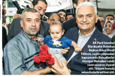
AK Parti İstanbul Büyükşehir Belediye Başkan Adayı Binali Yıldırım, seçim çalışmalar kapsamında Bakırköy'deki Hürriyet Mahallesi'ndeki semt pazarını ziyaret etti. Yıldırım burada vatandaşlarla sohbet etti.

yaç varsa onu yaparız. Bir sıkıntı yok. Şu anda büyük miting programımız yok. Gittiğimiz yerlerde, burada olduğu gibi toplanan vatandaşlarla selamlaşırız. Onların hal ve hatırlarını sorarız, dinleriz, önerilerini alırsak ve bu şekilde kampanyamızı tamamlayabiliriz." Yıldırım, daha sonra Ebuuziyya Caddesi'ndeki esnafı ziyaret ederek seçim çalışmalarını sürdürdü.