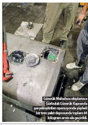
Gümrük Muhafaza ekiplerince Gürbülak Gümrük Kapısına girilen tirin yakıt deposunda şüpheli bir tirin yakıt deposunda toplam 84 kilogram eroin ele geçirildi.

Gürbülak Gümrük Kapısına İrlanda'dan gelen bir tir hakkındaki bilgi sistemleri üzerinden alınan uyarıya göre, ihbar kayıtları tespit edildi. Uyuşturucu kaçakçılığı şüphesi ile araç riskli olarak değerlendirildi. X-Ray taramasına sevk edilen tir yakıt deposunda şüpheli yoğunluğa rastlanmasının ardından, arama hangarına alınan tirin ayrıntılı kontrollerine narkotik dedektör köpekler de katıldı. Yapılan kontrollerde tirin yakıt deposundan birine dedektör köpeklerin tepki verdiği tespit edildi. Bunun üzerine yakıt deposu yerinden söküldü ve şüpheli bölge kesilerek açıldı. Gerçekleştirilen incelemede yakıt deposunun içerisinde gizli bir bölme oluşturulduğu ve bu bölme içerisinde sıkıştırılmış paketler bulunduğu saptandı. Bulunduktan yerden çıkarılan 113 adet uyuşturucu ve kimyasal madde test cihazı ile gerçekleştirilen analizde eroin cinsi uyuşturucu olduğu belirlendi.