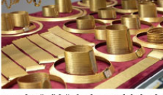
7 BİN KİŞİYE EKMEK KAPISI

Varank, Kahramanmaraş'ın 2020'de 800 milyon doların üzerinde ihracatını 1 milyar dolara ulaştıracağını vurgulayarak, "Ekonomi demek istihdam demek, sanayi demek istihdam demek. Biz Bakanlık olarak Sayın Cumhurbaşkanımızın liderliğinde bu şehri katma değerli sanayile buluşturmayı de-