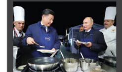
Rusya Devlet Başkanı Vladimir Putin ve Çin Devlet Başkanı Xi Jinping, Pekin'de düzenlenen forumda krep yapıyor.

11 Eylül saldırılarının yıl dönümü dolayısıyla ABD'nin DEAS'a karşı kendilerine verdiği destek için teşekkür ettiği ifade edilen açıklamada, Irak'taki dini azınlıkların durumunun da ele alındığı bildirildi. İran gücünün, önceki gün Erbil'de faaliyet gösteren İran-Kürdistan Demokrat Partisine (IKDP) ait bir kampa düzenlediği saldırıda aralarında üst düzey isimlerin de olduğu 16 İKDP'li ölmüş, yaklaşık 40 kişi de yaralanmıştı.