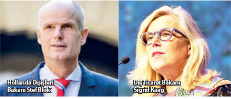
Hollanda Dışişleri Bakanı Stef Blok

Aynı zamanda Hollanda gazeteleri Nieuwsuur ve Trouw'un araştırmaları, hükümetin NLA programıyla 22 silahlı militan grubu desteklediğini ortaya koydu. Bunlara gönderilen malzemeler arasında üniformalar, aydud telefonları,