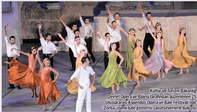
Kültür ve Turizm Bakanlığı Devlet Opera ve Balesi tarafından düzenlenen 25. Uluslararası Aspandos Opera ve Bale Festivali'nde, "Zorba" isimli bale gösterisi sanatseverlerle buluştu.