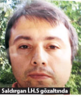
Saldirgan İ.H.S. gözaltında