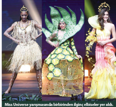
Miss Universe yarışmasında birbirinden ilginç elbiseler yer aldı.