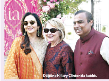
Düğüne Hillary Clinton'da katıldı.