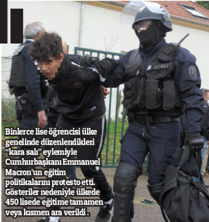
Binlerce lise öğrencisi ülke genelinde düzenlenen gösterilerle "kara salı" eylemiyle Cumhurbaşkanı Emmanuel Macron'un eğitim politikalarını protesto etti. Gösteriler nedeniyle ülkede 450 lisede eğitime tamamen veya kısmen ara verildi.

Macron, sanayicilerin protestolarına ilişkin dün akşam yaptığı açıklamada, şirketlere ek vergi yükü getirmeden asgari ücrette 2019 itibarıyla aylık 100 avro zam yapacağını açıklamıştı. Yapılacak işverenlerin çalışmalarına yıl sonunda prim ödemesini istediğini belirten Macron, 2 bin avronun alındığı emeklilik maaşından artık kesinti yapılmayacağını da duyurmuştu.