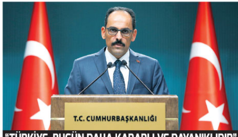
"TÜRKİYE, BUGÜN DAHA KARARLI VE DAYANIKLIDIR"

"ABD hem Obama hem de Trump döneminde, terör örgütü PKK'nın Suriye kolu olan PYGYPG ile işbirliği konusunda Türki-