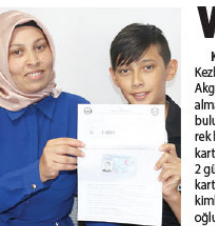
Kocaeli Valiliği, Gebze ilçesinde yaptığı sınavta başarılı olan öğrencilerin fotoğraflarını yayımladı. Fotoğrafta, Gebze ilçesinde yapılan sınavta başarılı olan öğrencilerin fotoğraflarını yayımladı.

Sınav giriş koşulları, sınav takvimi ve diğer hususlar, Akademilerin internet sitesinden ilan edilecek.