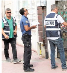
başkanlıklarında görevli zabita personelinin de içinde bulunduğu karma ekipler katıldı.

Türkiye genelinde eş zamanlı yapılan "Yabancı Şahıslara Yönelik Huzur Uygulaması", 6 bin 376 karma ekip ve 29 bin 208 personelin katılımıyla, 5 bin 395 noktada gerçekleştirildi.