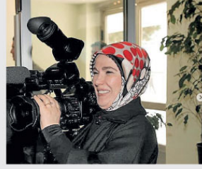
eminerdogan • Teklif Et

"Dünyanın dört bir yanında zor şartlar altında doğru, tarafsız, gerçek ve etik haberlik görevini yerine getirerek vatandaşların haber alma hakkını her koşulda gerçekleştiren tüm basın mensuplarının 10 Ocak Çalışan Gazeteciler Günü'nü kutladım. Kameramanımdan muhabirime, fotoğrafçımdan editörüne bütün basın emekçileri, bizlere ulaşamadığımız dünyalardan pencelelerini açıyor. Her birine gönülden teşekkür ediyorum."