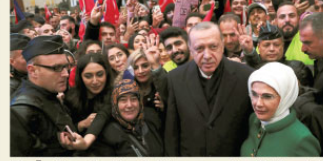
Erdoğan'a Paris'te sevgi gösterisi