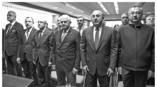
Başbakan Binali Yıldırım, "Bugün Amerika Birleşik Devletleri ile yaşamakta olduğumuz sorunlar geçicidir. Türkiye'nin dostluğu her zaman bütün müttefiklerimiz için önemli ve kıymetlidir. Cumhuriyetimizin kurucusu Gazi Mustafa Kemal Atatürk'ün prensibi yurtta sulh, cihanda sulhtur. Bu prensipten hareketle, bütün haksızlıklara karşı duruyor, bütün mazlumlara kucak açıyoruz, bölgesel ve küresel barış için insanlık adına büyük bedeller ödüyor, yerinden yurtdandan edilmiş milyonlarca insana evimizi açıyoruz, ekmeğimizi paylaşıyoruz. Bu bizi suçlayanlar yeryüzünde yaşanan acılar için bir kendilerinin ne yaptığına ne yapmadığına bakınlar, ondan sonra karar versinler." dedi

Yıldırım, "Küresel teröre karşı bütün ülkeler birbirinin hukukuna saygı göstermek zorundadır. Teröre karşı uluslararası alanda yalnız bırakılan Türkiye, terörden muzdarip bütün toplumların acısını en iyi şekilde anlamaktadır. Kısacası küresel gelişmeler