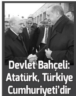
MHP Genel Başkanı Bahçeli, "Atatürk, Türkiye Cumhuriyeti'dir. Seneler geçip asırlar birbirini kovalasa da milletimiz, mazlum toplumlar ve vicdan sahibi her insanımız aziz Atatürk'e müteşekkirdir." değerlendirmesinde bulundu. MHP Genel Başkanı Devlet Bahçeli, Twitter hesabı üzerinden yaptığı paylaşımda, Cumhuriyetin kurucusu, milli mücadelenin kutup yıldızı Gazi Mustafa Kemal Atatürk'ün, vefatının 79. yılında saygıyla yad edildiğini belirtti. Atatürk'ün büyük bir komutan, üstün meşyetleri olan bir devlet ve siyaset adamı olarak Türk milletinin kalbinde taht kurduğunu vurgulayan Bahçeli, şöyle devam etti:

"O, milletine samimiyetle inanmış bir yürek, vatanına sevdalı faziletli timsali bir şahsiyettir. Elbette o, İstiklal ve İstikbal demektir. Ona, karamsarlığa tamah etmek, kararınlığa teslim olmak, yılmak ve yenilgiyi kabul etmek hiç görülmemiş, hiç rastlanmamıştır. Tarih boyunca, hürner ve hayyset sahibi devlet ve siyaset adamları için zorluklar, imkansızlıklar, darbegölgelere boyun eğme hali hiç yoktur." "Aziz Atatürk umut olmuş milleti kavramış, ufuk olmuş geleceği kurgulamış, güç olmuş vatani kurtarmış, ülkeyi olmuş Cumhuriyet kurmuştur." İfadelerini kullanan Bahçeli, harap olmuş bir ülkeyi, yorgun düşmüş bir milleti yeniden kuvvet haline getirmenin onuru marifeti ve muzaferliği olduğunu kaydetti.