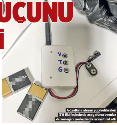
Gözaltına alınan şüphelilerden 3'ü ilk ifadesinde araç altına bomba düzeneğini yerleştirdiklerini itiraf etti

olarak yapılan çalışmalarda olay gerçekleştirildiği belirlenen şüphelilere yönelik sabah saatlerinde eş zamanlı operasyon düzenlendi. Operasyonda şüpheliler A.D, S.D, Ş.A. ve A.A. gözaltına alındı. Gözaltına alınan şüphelilerden 3'ü ilk ifadesinde araç altına bomba düzeneğini yerleştirdiklerini itiraf etti.