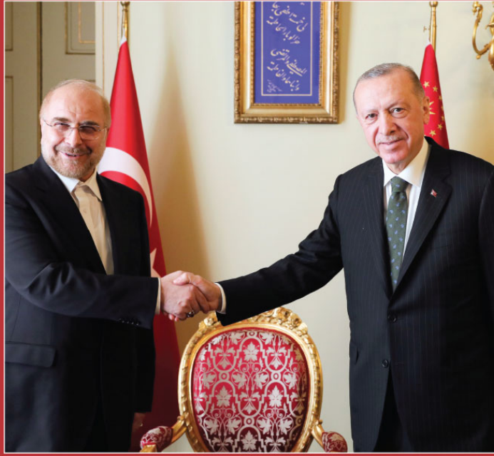
Cumhurbaşkanı Recep Tayyip Erdoğan, İran Meclis Başkanı Muhammed Bager Galibafı (solda) Dolmabahçe Sarayı'nda kabul etti.

Cumhurbaşkanı Recep Tayyip Erdoğan, "İnsan Hakları Tazminat Komisyonu'nun hareket kabiliyetini artıracığımız paketle kadınlara yönelik taciz ve takip eylemlerinin cezaları ağırlaştırılacaktır" dedi.