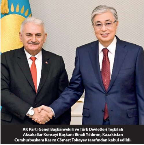
AK Parti Genel Başkanvekili ve Türk Devletleri Teşkilatı Aksakallar Konseyi Başkanı Binali Yıldırım, Kazakistan Cumhurbaşkanı Kasım Tokayev tarafından kabul edildi.