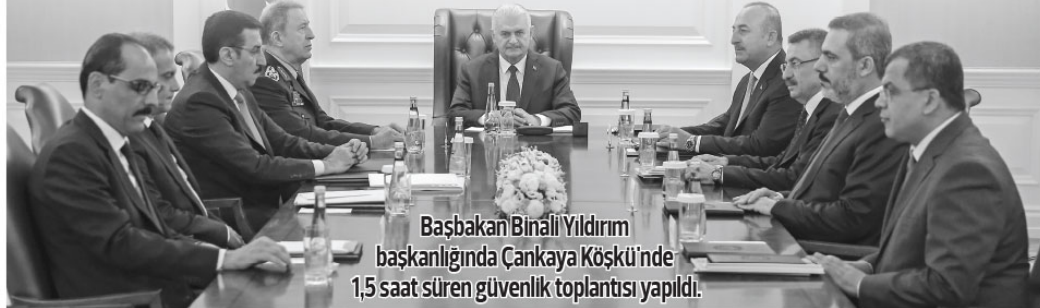
Başbakan Binali Yıldırım başkanlığında Çankaya Köşkü'nde 1,5 saat süren güvenlik toplantısı yapıldı.

Başbakan Binali Yıldırım başkanlığında Ankara'da güvenlik toplantısı yapıldı. Çankaya Köşkü'nde, basın kapalı gerçekleştirilen toplantı saat 10.25'te başladı 1,5 saat sürdü. Toplantıya Genelkurmay Başkan Oorgeneral Hulusi Akar, Dışişleri Ba-