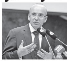
Başbakan Yardımcısı Şimşek, yeni yöntemle girişimcilere 2 milyar liralık kaynağı girişim sermayesi fonları aracılığıyla aktaracağını bildirdi.

Ekonomiden sorumlu Başbakan Yardımcısı Mehmet Şimşek, girişimcilere sağladıkları desteklere bir yenisi ekle-diklerini belirterek, "Yenilikçi ve teknoloji odaklı girişimci desteklemek amacıyla Hazine Müsteşarlığının girişim sermayesi fonlarına doğrudan kaynak aktarmasına imkan sağlayacak Bakanlar Kurulu kararını Başbakanlığa gönderdik." dedi.