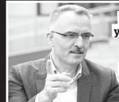
Maliye Bakanı Ağbal, "2018 yılı için yeniden yapılandırma kanunları kapsamında tahsil etmeyi beklediğimiz rakamı, ilk 2 taksitte geçtik. Vatandaşlarımıza teşekkür ediyorum." dedi.

Maliye Bakanı Nadı Ağbal, vergi borçlarının yeniden yapılandırılmasına ilişkin düzenlemelerin sonuçlarını değerlendirdi. Bazı alacakların yeniden yapılandırılmasına ilişkin 7020 ve 6736 sayılı kanunlar kapsamında, söz konusu tahsilatların yüksek şekilde devam ettiğine dle getiren Ağbal, "Yılbasından bu yana tahsil edilen toplam tutar 3 milyar 945 milyon lira oldu. Bunun 1 milyar 700 milyon lirasını mart ayında tahsil ettik." diye konuştu.