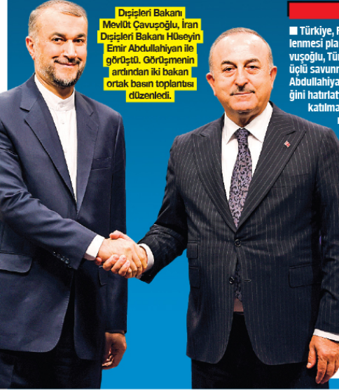
Dışişleri Bakanı Mevlüt Çavuşoğlu, İran Dışişleri Bakanı Höseyin Emir Abdullahiyan ile görüştü. Görüşmenin ardından iki bakan ortak basın toplantısı düzenledi.

Türkiye ile Suriye arasında Rusya'nın arabuluculuğunda başlayan süreçte ikinci aşamaya geçiliyor. Dörtlü formata evrilen süreç kapsamında Türkiye, Suriye, Rusya ve İran dışişleri bakanları görüşmesinin hazırlıkları için bakan yardımcısı Moskova'da dörtlü toplantıya katılacak.