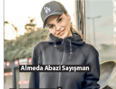
Almeda Abazi Sayışman

USTA oyuncu Haluk Bilginer, geçtiğimiz gün Zorlu Alışveriş Merkezi'nde objektiflere yansıdı. Tek başına geldiği AVM'de ilk durağı dünyaca ünlü markaların ve mağazaların bulunduğu meydan katında usta oyuncu, bir süre mağazaları dolaşarak alışveriş yaptı. Muhabirlerin fotoğraf istegini kırmayıp objektiflere poz verdikten sonra Zorlu Performans Sanatları Merkezi'nde sahnelenen 'Kel Diva' adlı tiyatro oyununun provaları için PSM'ye geçen başarılı oyuncu, "akşam sahnenizi var herkesi bekliyoruz" dedi.