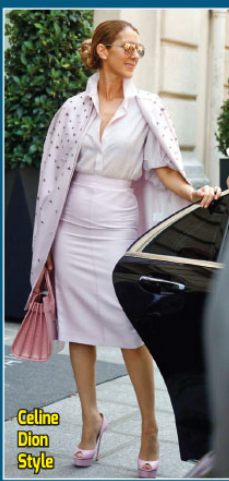
Celine Dion Style