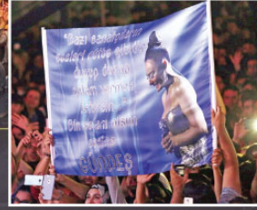
Hayranları Ebru Gündeş'i özenle hazırladıkları pankartlarla karşıladı. "Bazı sanatçıların sesleri rütbe gibidir. Durup durup selam vermek istersin. Bin selam olsun sesine Gündeş" yazılı pankartların gecenin en dikkat çeken detaylarındandı.