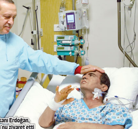
Cumhurbaşkanı Erdoğan, Süleymanoğlu'nu ziyaret etti

AK Parti 26. İstisna ve Değerlendirme Toplantısı kapanış oturumunda konuşan Cumhurbaşkanı Recep Tayyip Erdoğan, İdlib'deki operasyona değindi. Suriye'nin en doğusundan Akdeniz'e oluşturulmak istenen terör koridorunu bozarak mecburiyetinde olduklarını vurgulayan Cumhurbaşkanı Erdoğan, "Eğer biz buna müsaade edersek yeni bir Kobani yaşarız. Kusura bakmasınlar, biz yeni bir Kobani yaşamak istemiyoruz ve bunu yaşatmayacağız." ifadelerini kullandı. Sayfa 10