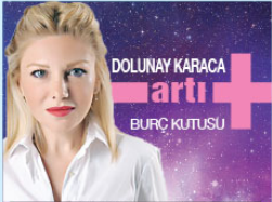
DOLLUN KARACA ARTI BURÇ KUTUSU

Sağlıklı yaşam bir seçenektir. 50 yaşından önce 40 yaşında görünmeyim ve gün içinde enerjimi sürekli yüksek olsun diyorsanız sağlıklı beslenmeyi ve fiziksel aktiviteyi yaşam tarzını haline getirin. İnsanoğlu genelde hastalıklara yakalandıktan sonra tedavi olmayı seçer ancak hastalıkları yakalandıktan önce bunları engellenebilecek nedenleri hastaya olmayı bekleylelim ki?