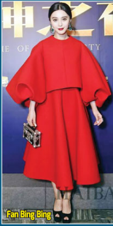
Fan Bing Bing