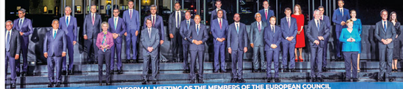
INFORMAL MEETING OF THE MEMBERS OF THE EUROPEAN COUNCIL Brdo pri Kranju 2021

AB-Batı Balkanlar zirvesinde konuşan Avusturya Başbakanı Kurz, AB'nin bölgeye üyelik perspektifi sunmaması durumunda burada "Rusya, Çin ve Türkiye gibi süper güçlerin rolünün artacağı" uyarısı yaptı.