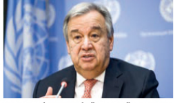
GUTERRES'İN HAMLASI DÜNYADA GÜNDEM OLDU