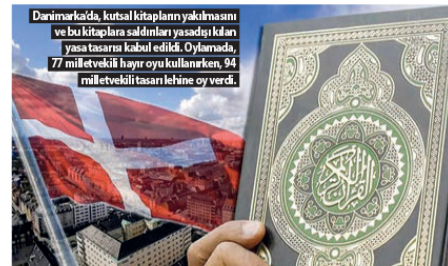
Danimarka'da, kırsal kitaplarını yakılmasını ve bu kitapların saldımları yasadığı idan yasa tasarımı kabul edildi. Oylamada, 77 milletvekili hayır oyu kullanırken, 94 milletvekili tasarımı lehine oy verdi.

İsveç ve Danimarka'da birçok kez Kur'an-ı Kerim yakma eylemleri düzenlenmişti. İslam İştirakî Teşkilatı ve üyelerinin birçok bu eylemleri şiddetle kınar. Danimarka'da aşın sağcı politikacı ve Sika Yon Partisi lideri Rasmus Paludan, 2022'de Paskalya tatilinde boyunca İsveç'in Malmö, Norrköping, Jönköping kentleri ile başkent Stockholm'de Kur'an-ı Kerim yakma eylemlerini sürdürmüştü.