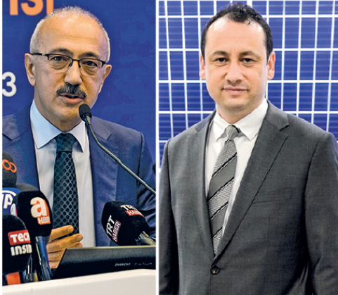
"2025 YILINDA 500 MEGAVAT İHRACAT HEDEFİYORUZ"

"Konya Karapınar'da 1300 megavat güce sahip Avrupa'nın en büyük, dünyanın da sayılı güneş enerjisi santrallerinden birini kurduk. Sadece bu fabrika için 500 milyon dolarlık bir yatırım gerçekleştirdik. Hedefimiz 100 milyon dolar daha ilave yatırım yapmak. Fabrikamızdaki yıllık 2 gigavatlık kapasiteyi de artırmaya devam edeceğiz. Tüm bunlar, Türkiye vizyonunu değiştirmiş vizyonun tam da kendisi."