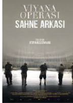
VIYANALI OPERASI SAHNE ARKASI