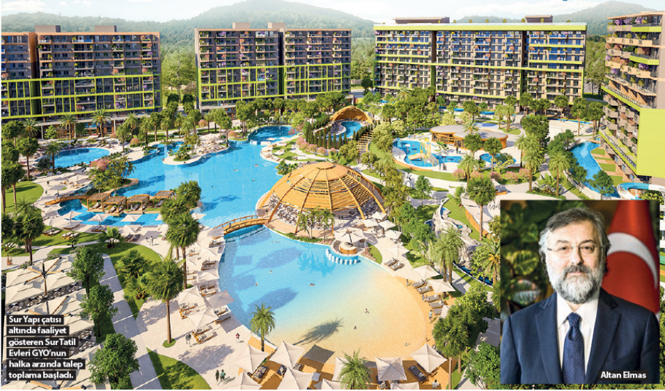
Sur Yapı çatısı altında faaliyet gösteren Sur Tatil Evleri GYO'nun halka arzında talep toplama başladı.