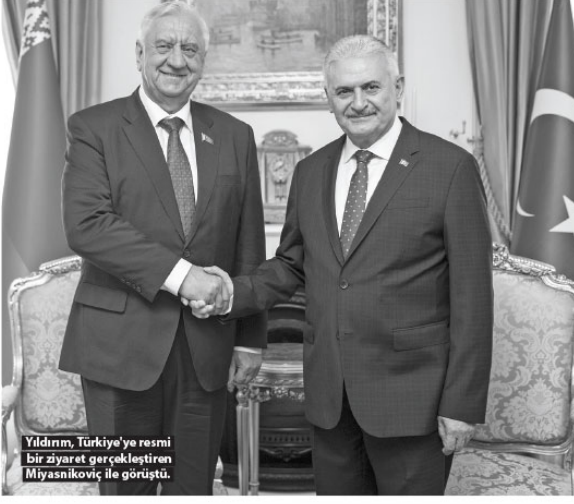
Yıldırım, Türkiye'ye resmi bir ziyaret gerçekleştirilen Miyasnikoviç ile görüştü.

Görüşmede, Türkiye ile Belarus arasındaki siyasi ve parlamentolararası ilişkiler dahil tüm alanlarda işbirliğinin daha da gelişmesi, ekonomi, ticaret ve yatırım alanındaki karşılıklı teşviklerin artırılması konusunda ortak irade teyit edildi. Konuk heyet, Türkiye ile Belarus arasındaki mükemmel seviyede seyreden ilişkilerden duyulan memnuniyeti dile getirdi.