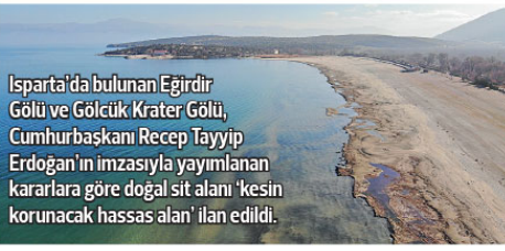
Isparta'da bulunan Eğirdir Gölü ve Gölcük Krater Gölü, Cumhurbaşkanı Recep Tayyip Erdoğan'ın imzasıyla yayımlanan kararlara göre doğal sit alanı 'kesin korunacak hassas alan' ilan edildi.