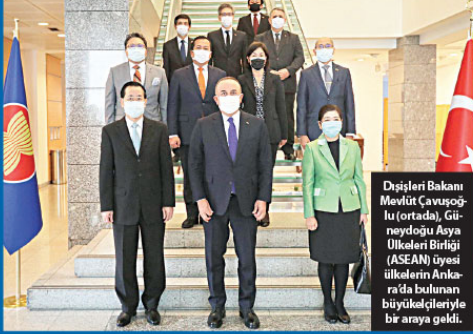
Dışişleri Bakanı Mevlüt Çavuşoğlu (ortada), Güneydoğu Asya Ülkeleri Birliği (ASEAN) üyesi ülkelerin Ankara'da bulunan büyükelçileriyle bir araya geldi.

Karşılıklı büyükelçiliklerin ikili ilişkilerde katkısını önemli olduğunu işaret eden Çavuşoğlu, "Özellikle de ekonomi diplomasiyle izlediğimiz başarılı çalışmalarla