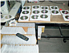
616 kişi hakkında işlem yapıldı.

Eğitim alanında 228 milyon 730 bin 321 bantrol satışı yapıldığı 2020 yılında, yetişkin kategorisinde 90 milyon 201 bin 549, çocuk-gençlik kategorisinde 44 milyon 763 bin 278, yetişkin kurgu kategorisinde 32 milyon 354 bin 331, inanç kategorisinde 26 milyon 693 bin 426, akademik alanda 5 milyon 514 bin 246, ithal yayın kategorisinde de 4 milyon 956 bin 481 adet bantrol satıldı.