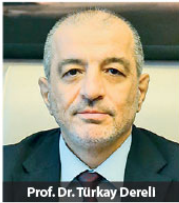
Prof. Dr. Turkey Dereli

KOBİ'lere ve girişimcilere mentorluk ve prototip desteği sağlayan Hasan Kalyoncu Üniversitesi (HKÜ), geliştirdiği son proje ile AB'den 250 bin Euro'ya kadar hibe almaya hak kazandı. Üniversite bünyesinde kurulan Kalyon Garaj Girişimcilik ve Prototipleme Merkezi, son 3 yılda yaptığı toplam 14 proje ile TÜBİTAK, KOSGEB ve AB fonlarından KOBİ'ler ve girişimciler için yaklaşık 2,5 milyon TL finans desteği sağladı.