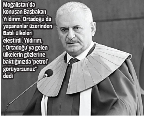
Mogolistan'da konuşan Başbakan Yıldırım, Ortadoğu'da yaşananlar üzerinden Batılı ülkeleri eleştirdi. Yıldırım, "Ortadoğu'ya gelen ülkelerin gözlerine baktığınızda 'petrol görüyorsunuz" dedi

"Biz münasebet kurduğumuz ülkelerin yer altı ve yer üstü zenginliklerine değil insanını merkeze alan bir düşünce anlayışıyla hareket ediyoruz. Bizim ülkelerle ilişkilerimize baktığımız zaman göreceğimiz şey insanlıktır, dostluk. Tarihin hiçbir döneminde hiçbir ulusunu esaret altına almamış daima insanlığın huzuru için çalışmış bir milletten evlatlarıyız. Şu anda dünyanın birçok