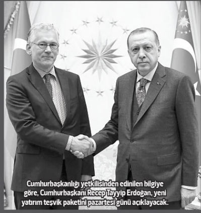
Cumhurbaşkanlığı yetkilisinden edinilen bilgiye göre, Cumhurbaşkanı Recep Tayyip Erdoğan, yeni yatırım teşvik paketini pazartesi günü açıklayacak.

Faizlerin aşağıya düşürülmesiyle ilgili bir çalışma olup olmadığıyla ilgili bir soruya Ağbal, "Ekonomi bir bütündür. Ekonomideki kararlar, ekonomi üzerinde yapılacak çalışmaları tek bir eksen üzerinde tutularak konuşulmaz ve çalışılmaz. Ekonominin bir taraftan sahip olduğu potansiyel bütüne oranlarını destekleyecek, diğer taraftan da ekonomik kararları olumlu yönde etkileyecek, ekonomide sürdürülebilirliği, ekonomide yakalması olduğumuz istikrarı devam ettirecek, bütüncül kararları da birlikte alacağız" dedi.