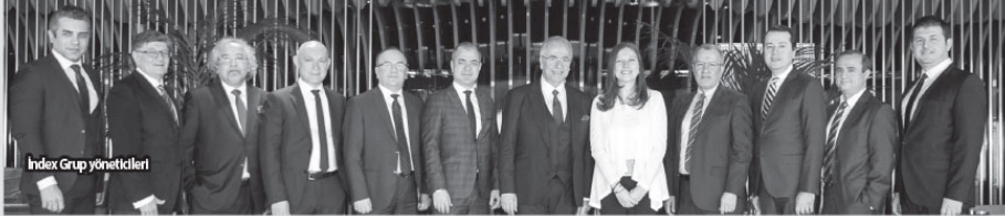
Index Grup yöneticileri