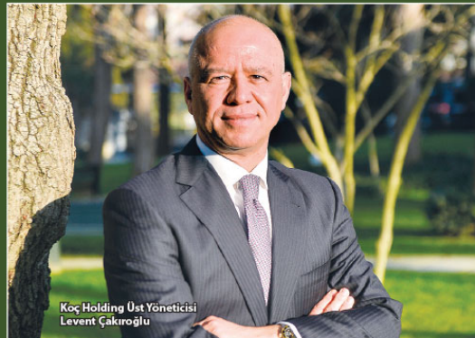
Koç Holding Üst Yöneticisi Levent Çakıroğlu

imizdeydi ancak Karbon Dönüşüm Programımızla birlikte daha sistematik ve daha iddialı hedeflerle bu konuyu yöneteceğiz." Çakıroğlu, Fortune Global 500'de bu yıl da Türkiye'yi temsil eden tek şirket olduklarını anımsatarak, "Türkiye İhracatçıları Meclisi'nin gerçekleştirdiği Türkiye'nin ilk 1000 İhracatçısı listesinde 4 şirketimizle bu yıl da ilk 10 içinde yer aldık. Ayrıca Forbes'un 'Dünyanın En İyi İşverenleri Listesi'nde bu yıl da Türkiye'nin en iyi işvereni hakkı gururunu yaşıyoruz. Başarılarımızın hem ülke çapında hem de küresel ölçekte takdir görmesinden gurur duyuyor, bu başarıları mümkün kılan çalışmaya arkadaşlarımızla, başarılarımızla ve tedarikçilerimizle şükranlarımızı sunuyoruz." ifadelerini kullandı.