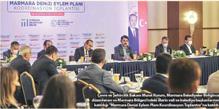
Çevre ve Şehircilik Bakanı Murat Kurum, Marmara Belediyeler Birliğince düzenlenen ve Marmara Bölgesi'ndeki illerin valisi ve belediye başkanlarının katıldığı "Marmara Denizi Eylem Planı Koordinasyon Toplantısı"na katıldı.