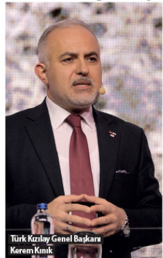
Türk Kızılay Genel Başkanı Kerem Kınık