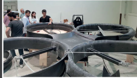
Teknofest bünyesinde Uçan Araba Tasarım Yarışması yapıyoruz. Türkiye'nin araştırma, geliştirme ve üretken bir gençlikle zinde yerini alacağına inanıyoruz"

Aynı gerekçelerle gençlerimizin bu teknoloji yarışında geri kalmamaları ve gelecekte söz sahibi olabilmeleri için