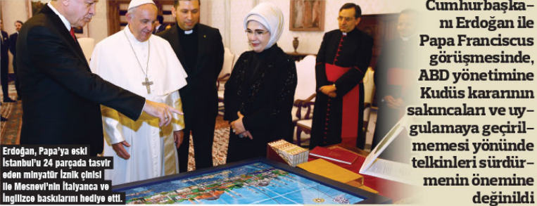
Erdoğan, Papa'ya eski İstanbul'u 24 parçaya tasvir eden minyatür iznik çinisi ile Mesnevi'nin İtalyanca ve İngilizce baskılarını hediye etti.

Cumhurbaşkanı Erdoğan ile Papa Francis görüşmesinde, ABD yönetimine Kudüs kararının sakıncaları ve uygulamaya geçirilmemesi yönünde telkinleri sürdürmenin önemine değinildi