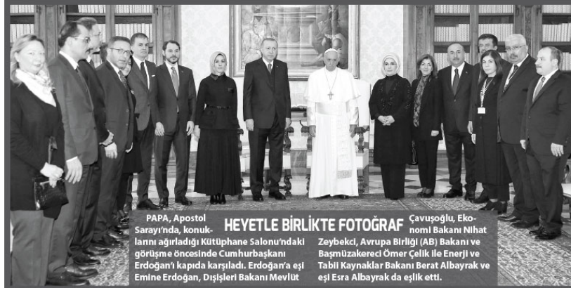
PAPA, Apostol Sarayı'nda, konuşmalarını açıkladığı Kütüphanesi'ndeki görüşme öncesinde Cumhurbaşkanı Erdoğan'ı kapıda karşıladı. Erdoğan'ın eşi Emine Erdoğan, Dışişleri Bakanı Mevlüt

Türkiye'de Katolikler dahil farklı inançlara mensup herkesin barış içerisinde bir arada yaşamasına önem verdiklerini anlatan Cumhurbaşkanı Erdoğan, bu iradeyi somut olarak ortaya koyma adına son dönemde 14 kilise ve bir sinagoga onarıldığını dikkatli çekti. Cumhurbaşkanı Erdoğan ve Papa Francisus, bölgede barış ve istikrarın tesis edilmesi, yaşanan insani dramalara seyirci kalmaması için uluslararası toplumu harekete geçirmesi hususunda ortak adımların atılmasının mümkün olduğunu işaret etti ve gelecekte de temasları sürdürme konusunda mutabık kaldı.