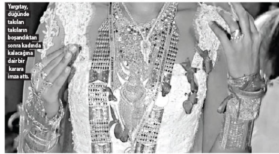
Yargıtay düğünde takılan takıların boşandıktan sonra kadında kalacağına dair bir karara imza attı.

Mahkemede ifade veren davacı koca ise; birikim yaparak borçsuz olarak evlendiğini, davacının para ve altınların bir kısmını kendi şahsi harcamaları için kullandığını, bir kısmını da borsada kaybettiğini beyan etti. Davanın reddine karar vermesini talep eden davalı iddiaları reddetti. Mahkeme sadece geline takılan takıların iadesine hükmetti.