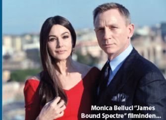
Monica Bellucci "James Bond Spectre" filminden...