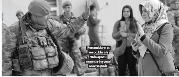
Komandoların eş ve çocuklarıyla vedalaşması sırasında duygusal anlar yaşandı.

Sirt'te bir tabur komando, Türk Silahlı Kuvvetlerince (TSK) Suriye'nin kuzeybatısındaki Afrin bölgesinde terör örgütleri PYD/PKK ve DEAS'a yönelik başlatılan Zeytin Dalı Harekatı'na katılmak üzere bölgeye gitti.