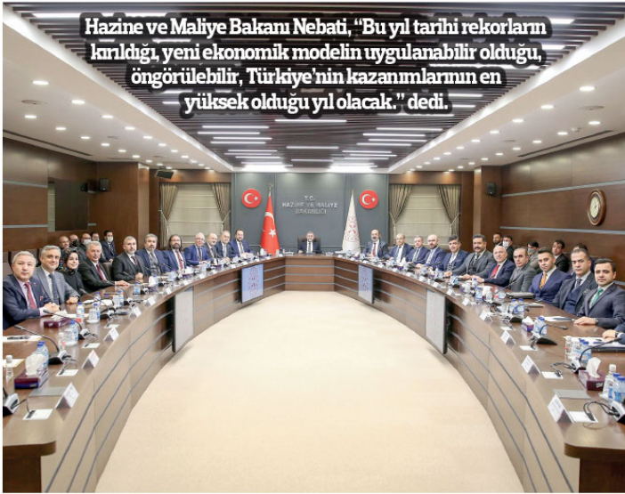
Hazine ve Maliye Bakanı Nebati, "Bu yıl tarihi rekorları kırdığı, yeni ekonomik modelin uygulanabilir olduğu, öngörülebilir, Türkiye'nin kazanımlarının en yüksek olduğu yıl olacak." dedi.

Nebati, son yıllarda küresel arz ve talep zincirlerindeki önemli değişimleri beraberinde getirdiğini değerlendirerek, şöyle devam etti: "Türkiye olarak amacımız bu dönüşüme yalnızca ayak uydurmak değildir. Aynı zamanda bu dönüşümü yıl vermektir. Türkiye bu rolü hak ediyor ve bunu ustalıkla yerine