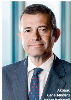
Akbank Genel Müdürü Hakan Binbaşgil

Finansal kaynaklara erişimi kısıtlı kesimler için ortaya koyduğumuz ürün ve hizmetlerle finansal kapsayıcılığı iş modelimizin bir parçası haline getirdik. Yenilikçi bakış açımız sayesinde geleneksel bankacılık hizmetlerinin de ötesine geçiyoruz. Giderek dijitalleşen dünyaya paydaşlarımızın mevcut veya henüz ortaya çıkmamış ihtiyaçlarını karşılamak için hızlı ve etkin çözümler geliştireyoruz. Dijital bankacılık bizim için müşteri deneyimini mükemmelleştirmeyi hedefleyen bir yaklaşıma ek olarak, finansal kapsayıcılığı geliştirmek için de önemli bir araçtır. Bu kapsamda, müşterilerimiz sunduğumuz dijital ve yenilikçi ürün ve hizmetleri geliştirecek yatırımlara odaklanacağız. 2030 yılına kadar finansal acidan güçlendireceğimiz kişi sayısını artıracacağız.