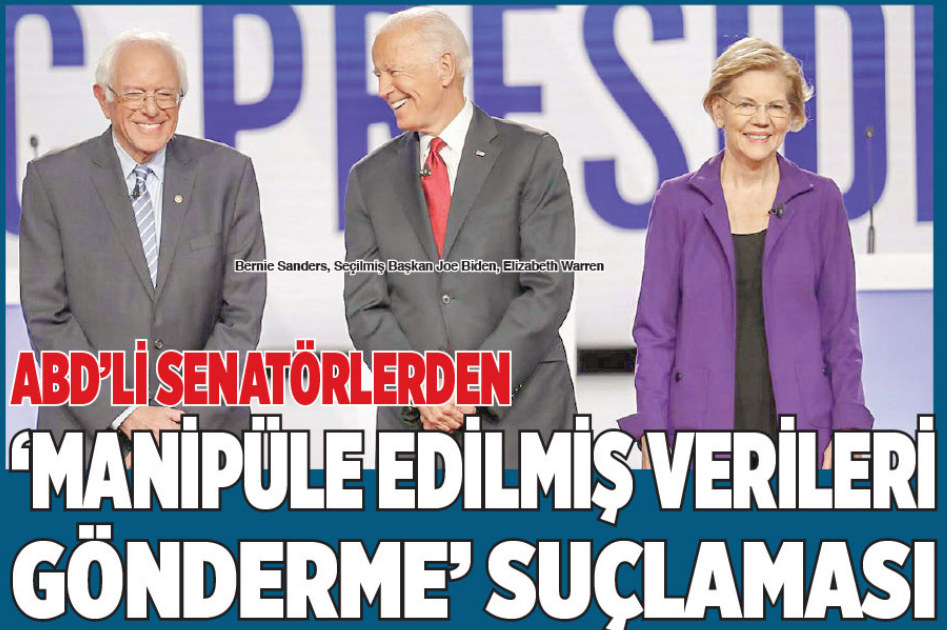
Bernie Sanders, Seçilmiş Başkan Joe Biden, Elizabeth Warren