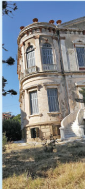
Eskiden Arkeoloji Müzesi olarak da kullanılan bu bina gibi taş evler adada çoğunlukta.

Bu ağaçlardan çıkan sümüç, 20 milyon yıl önce, Kuzey Ege'de yoğun bir volkanik faaliyet yaşandığını gösteriyordu. Midilli merkezindeki bir dizi volkanik patlamadan kaynaklanan küllü ve camur seli anızın ormansız kaplaması, Ağaçlar öyle hızlı gömülmüştü ki kütü bile dönüştürmüştü. Yani artık o kadar seneyi düşünmek çok ilginç. 2004'te UNESCO Global Jeoparkları Ağ'ına kabul edilmiş. 2009'da Avrupa Komisyonu ve Yunanistan Turizm Bakanlığınca Avrupa Seçkin Destinasyonlar (EDEN) ödülüne layık görülmüş.