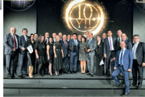
Renault Mais ekibi ödül töreninden sonra 20. Kez lider olmanın mutluluğu ile biraraya geldi.

desteği hem de hurda teşvihi sayesinde desteklenen talep ve yılın sonunda yerli üretim araçlara kamu bankaları tarafından sağlanan finansman desteği ile 2019 yılında pazarı, yılın başındaki tahminlerimizden çok daha iyi bir seviyede kapatabildik. Bu yıl 20. kez elde ettiğimiz binek otomobil lider-