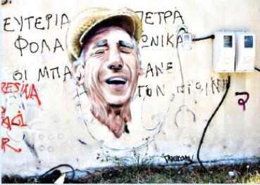
En etkileyici graffiti sanatlarından bazıları bu adada her yerde karşınıza çıkıyor.

Midilli, Ege Deniz'i'nin kuzeydoğusunda bulunan, dağlık bir Yunan adası. Yunanistan'ın ana karasından çok Türkiye'nin Ayvalık ile Burhaniye ilçelerine yakın. Bir buçuk saatte "Feribotmuş" motor ile bir kıydan diğerine gidebiliyorsunuz. Girit ve Eğriboz'dan sonra Yunanistan'ın en büyük üçüncü adası Midilli. Başkenti Mytilene. Ünlü Yunan şairleri Alcaeus ve Sappho'nun da memleketi.