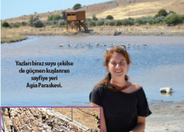
Yazları biraz suyu çölsü de gişimem kuzuların sayfiye yeri Agia Paraskevi.