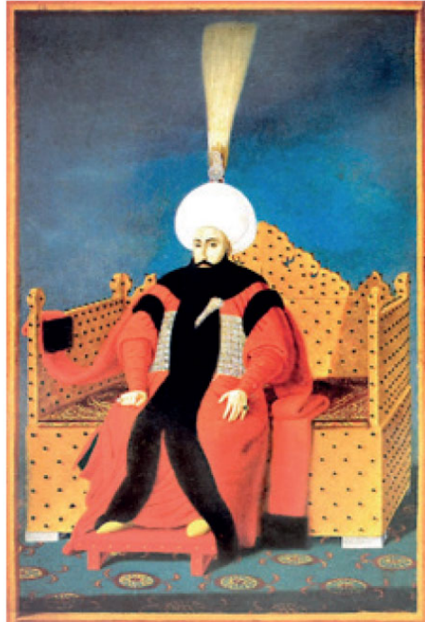
(Sultan IV. Mustafa Han -DİA, c.31, s.283)

Böylece kaderin bir cilvesi vuku bulmuştur. Zira Sultan IV. Mustafa tahta olduğu dönemde, Alemdar'ın sarayı basması karşısında, amcası ve kardeşinin öldürülmesi emrini vererek hayattaki tek hanedan mensubu olarak padişahlığı