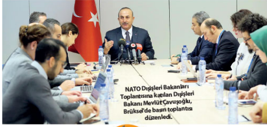
NATO Dişşeri Bakanları Toplantısına katılan Dişşeri Bakanı Mevlüt Çavuşoğlu, Brüksel'de basın toplantısı düzenledi.

Ukrayna ile Rusya arasında Azak Denizi'ndeki krize Türkiye'nin arabulucu olması konusunda bir soruya ilişkin, Çavuşoğlu, kriz yaşandıktan sonra Cumhurbaşkanı Recep Tayyip Erdoğan'ın