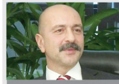
Londra Adalet Müşaviri görevden alındı

"R. adlı terörist bana, annesinin örgütte iken hamile kaldığını, doğumundan itibaren annesi ve babasıyla hiç görüşülmediğini, 7 yaşına kadar Irak'ın Mahmur kampında başka örgüt mensupları tarafından büyütüldüğünü, 13 yaşında örgüte tam olarak katıldığını, kendisini yetiştiren örgüt mensuplarıyla görüşüğünü, fakat biyolojik anne ve babasını hiç tanımadığını söyledi. R. bana, kampla kendisi gibi 10-15 teröristin olduğunu, bu şekilde doğan çocuklarla annelerinin temasının örgüt yönetimi tarafından sonlandırıldığını ve anne örgüt mensuplarının başka faaliyet alanlarına sevk edildiğini söyledi."