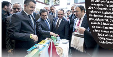
"5 Aralık Dünya Toprak Günü" etkinliği Tarım ve Orman Bakanlığı binasında gerçekleştirildi. Etkinliğe katılan Tarım ve Orman Bakanı Bekir Pakdemirli, bakanlık binasında açılan standları ziyaret etti.

Birleşmiş Milletler Gıda ve Tarım Örgütü (FAO) Türkiye Temsilcisi Virel Gutu da toprak kirliliğinin küresel bir sorun olduğunu dikkati çekerek, "Toprak Kirliliğine Çözüm Ol" kampanyasıyla farkındalığı artırmayı amaçladıklarını ve insanların "Toprak kirliliğini durdurun" çağrısında bulduklarını söyledi.