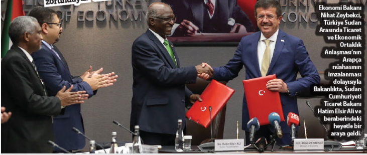
Ekonomi Bakanı Nihat Zeybekci, Türkiye Sudan Arasında Ticaret ve Ekonomik Ortaklık Anlaşması'nın Araçça nüshasının imzalanması dolayısıyla Bakanlıkta, Sudan Cumhuriyeti Ticaret Bakanı Hatim Elsis Ali ve beraberindeki heyetle bir araya geldi.