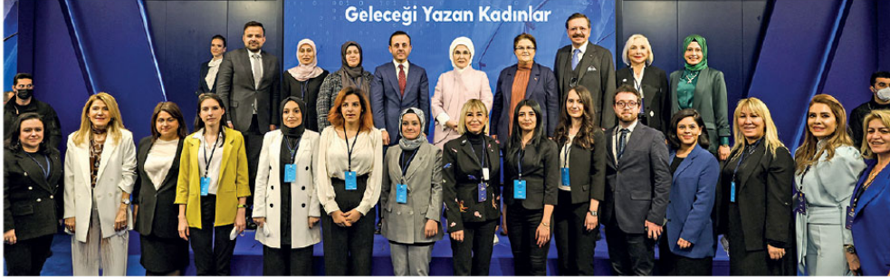
Geleceği Yazan Kadınlar