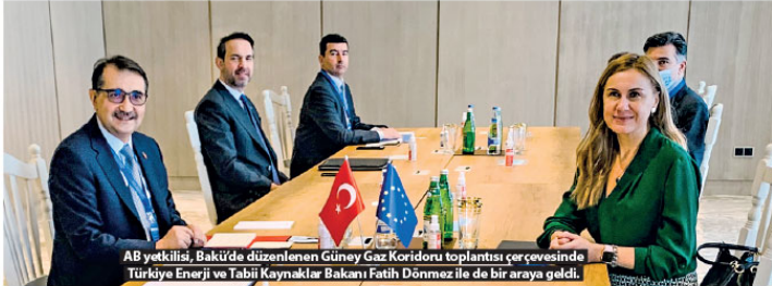
AB yetkilisi, Bakü'de düzenlenen Güney Gaz Koridoru toplantısı çerçevesinde Türkiye Enerji ve Tabii Kaynaklar Bakanı Fatih Dönmez ile de bir araya geldi.

Güney Gaz Koridoru yoluyla AB'ye doğal gaz sevkiyatını artırma çabalarından dolayı Azerbaycan'a teşekkür eden Simson, Azerbaycan'ın "güvenliliğini ve büyük bir ortak olduğunu" bir kez daha gösterdiğini söyledi.